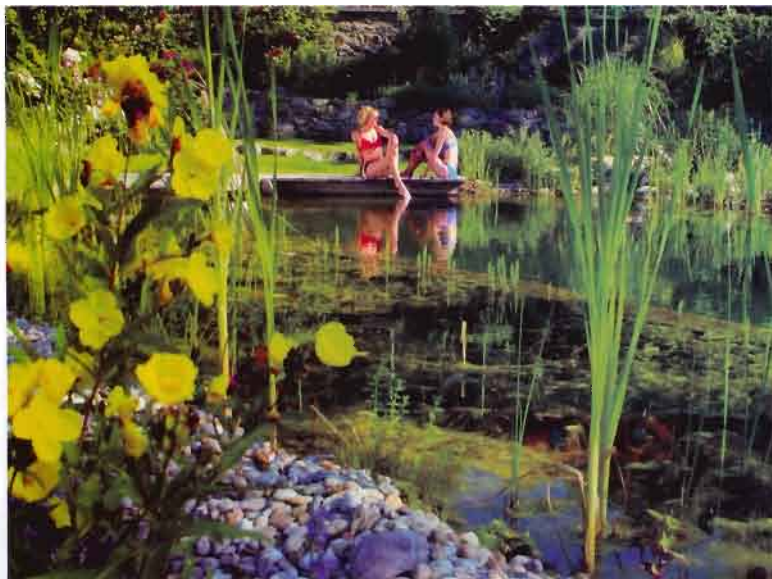
Qui, e nella foto accanto, due diverse interpretazioni della piscina naturale di Original Biotop – Swimming Bio Piscine

piante. Solo in casi particolari, quando entrano nel sistema elementi indesiderati come concimi, sostanze chimiche o germi, può essere necessario un cambio totale.