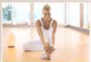
PARQUET: NOVITÀ E TENDENZE

Poste Italiane SpA - Sped. A.P. - D.L. 352/2003 conv. n. 46 art. 1 comma 1 CN/CPA - NUD2 Callianese/Conte/LEP