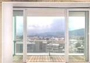
INFISSI FUNZIONALI E MODERNI