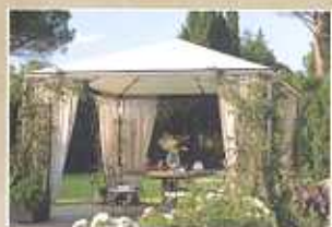
COME SCEGLIERE IL GAZEBO