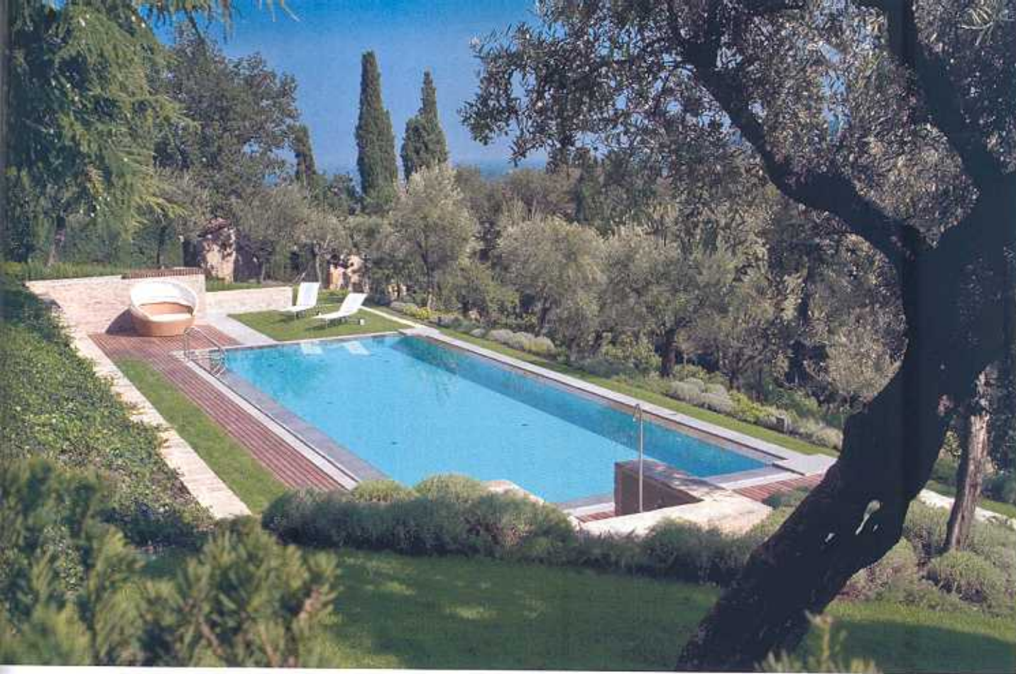
Sopra, un esempio di costruzione nascosta dalla natura circostante. In questo caso, la piscina è a sfioro e si inserisce perfettamente fra il prato e gli alberi, creando una sorta di oasi in mezzo al verde.