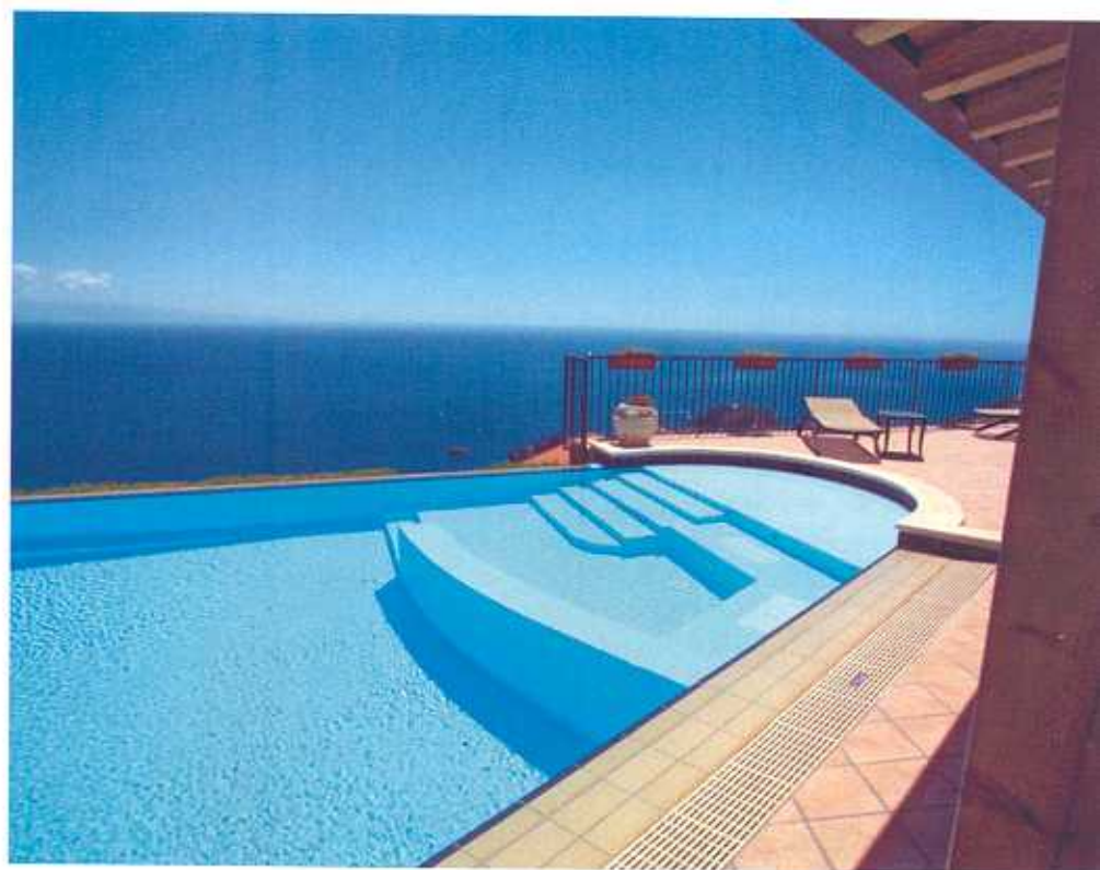
A sinistra, una realizzazione di Sala, con pavimento a mosaico. Qui sopra, di Piscine Castiglione, piscina con bordo a cascade, piastrelle Ceramic 3, tecnologia Mirtha e area d'entrata con panca idromassaggio.