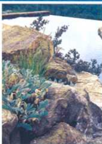
In questa pagina, una piscina a Panzano in Chianti, dell'architetto Marco Pozzoli. Realizzata su un pendio, ha rivestimento in pietra del luogo e particolari massi irregolari, lavorati appositamente sul posto.

no tante e il mercato è in grado di proporre soluzioni sempre più aggiornate, il progettista diventa spesso l'interlocutore più adatto per sbrogliare l'ampia matassa e indicare il filo che guida le decisioni. Certo, le variabili da prendere in considerazione sono molte e si può affrontarle a una