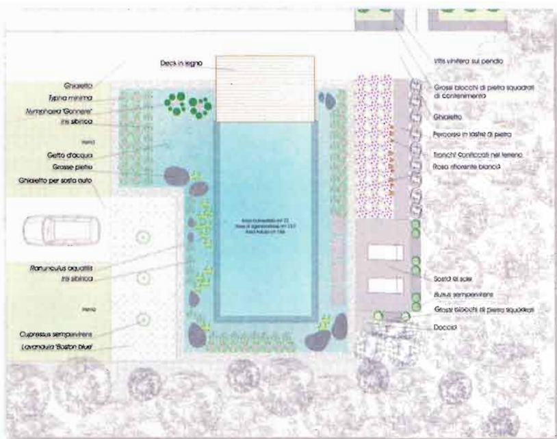
La planimetria del progetto

Tutt'intorno alla piscina sono stati sistemati arbusti e fioriture tardo primaverili-estive, composte da lavande nane e rose dal colore bianco crema.