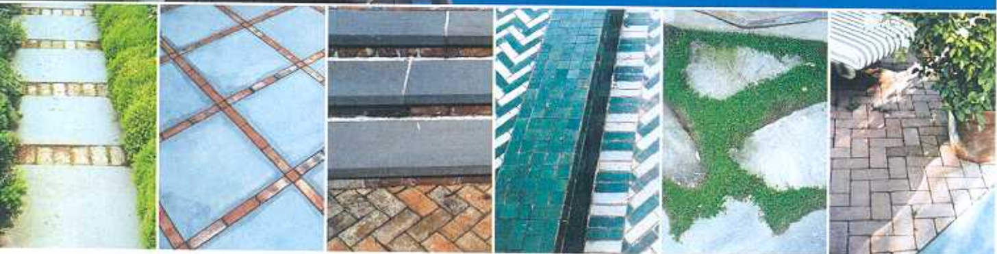
Le pavimentazioni sono tratte dal libro The Swimming Pool di Maurizio Barbero edito da Carabba.

Che cosa c'è di meglio, nella bella stagione, che tuffarsi appena svegli in una piscina, per cominciare bene la giornata? Un sogno hollywoodiano, fino a qualche decennio fa. Oggi le piscine sono un valore aggiunto alle case e al benessere. E, del resto, un mercato in costante crescita consente la realizzazione di ogni tipo di piscina, per tutti gli stili e per tutte le disponibilità. Dalle più semplici, prefabbricate, in metallo o vetroresina, alle