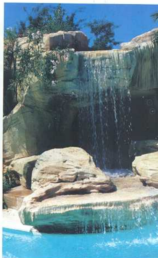
Nella foto, il dettaglio della suggestiva cascata della piscina naturale creata da Busatta.

L'assoluta mancanza di bordi, il colore dell'acqua cristallino e le rocce naturali, sono solo alcune delle caratteristiche che rendono uniche le piscine realizzate da Busatta.